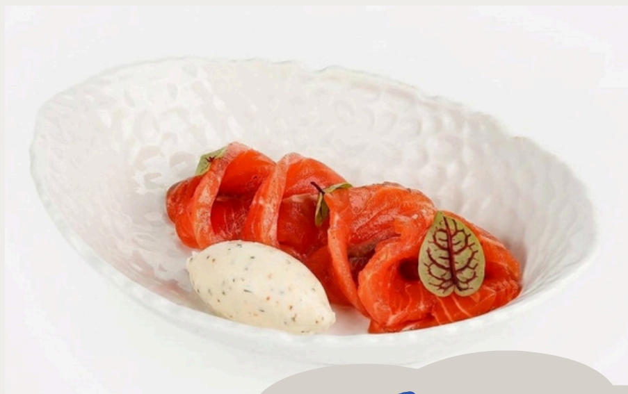
Лосось с лимонным маслом 100г/1100р