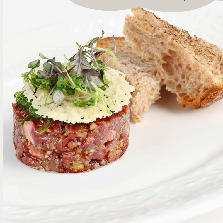
Тар-тар из говядины 180г/1100р