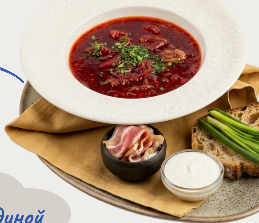
Борщ с говядиной 430г/590р