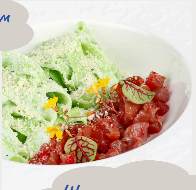
Шпинатная паста с тар-таром из тунца 260г/820р