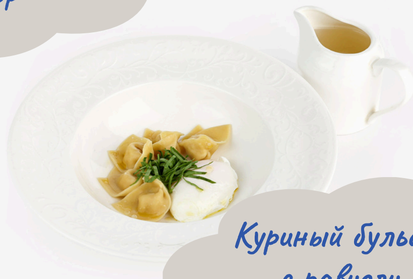
Куриный бульон с равиоли 350г/490р