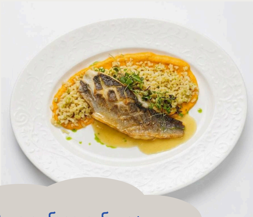
Филе сибаса с булгуром и морковным кремом 220г/1290р