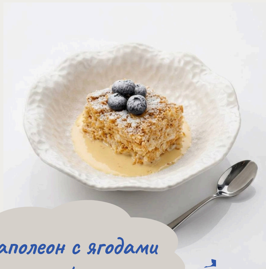
Наполеон с ягодами 190г/550р