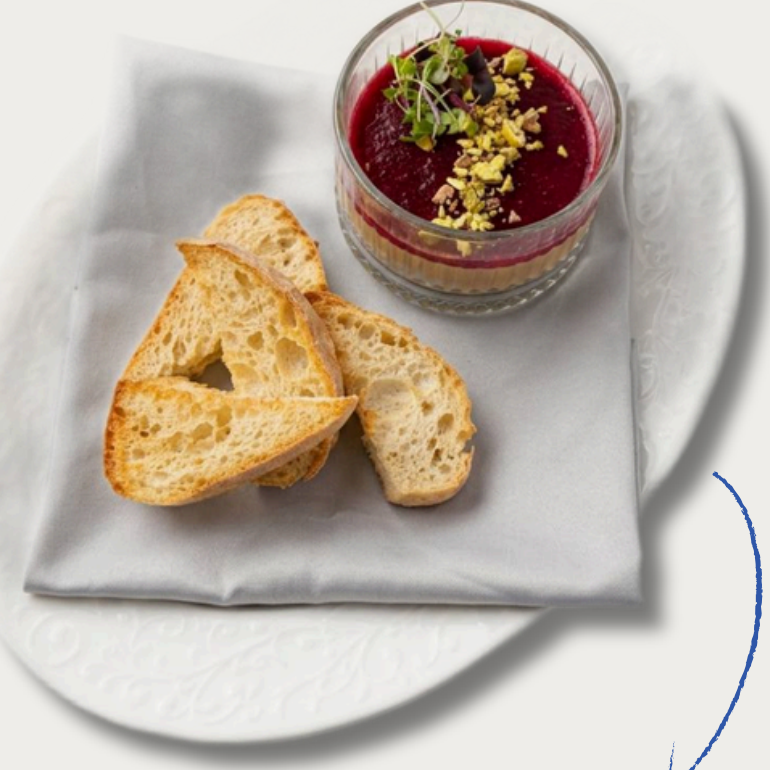
Паштет с малиновым конфи 180г/590р