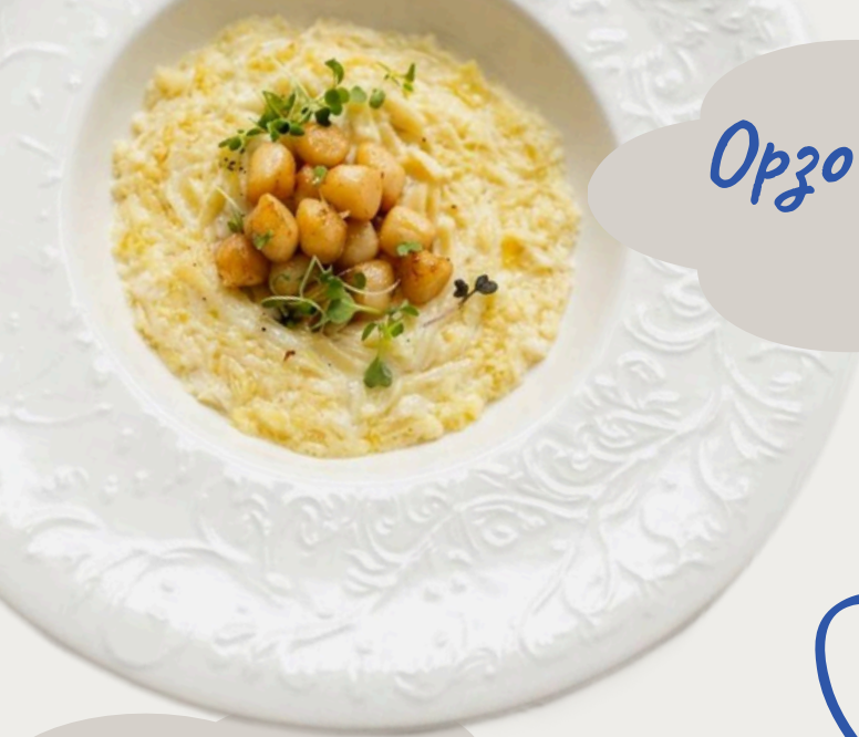
Орзо с гребешком 230г/920р