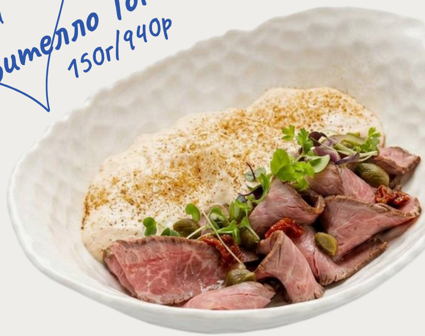
Вителло Тоннато 150г/940р