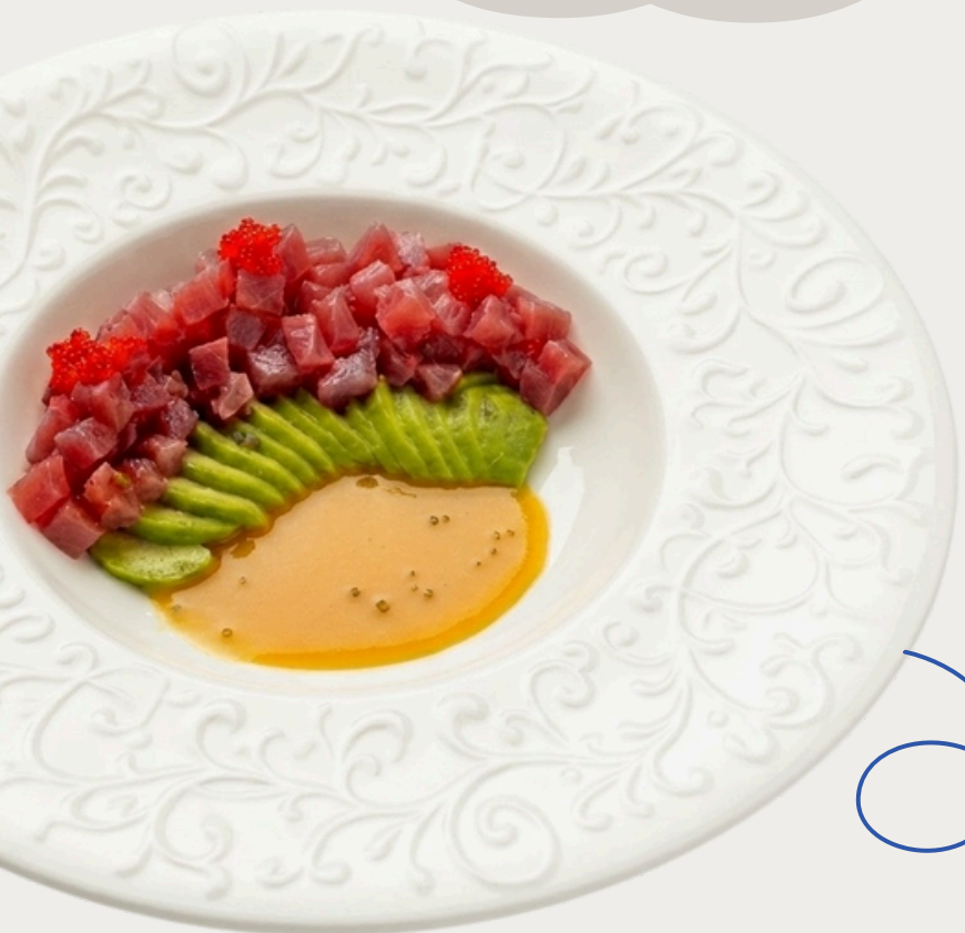
Тар-тар из тунца 160г/820р