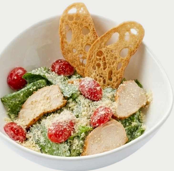
Цезарь с курицей 200г/690р