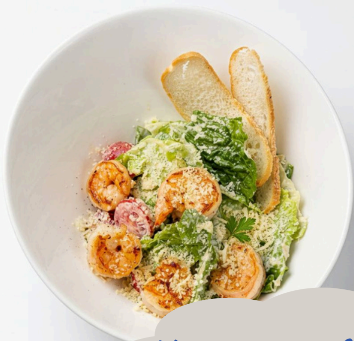
Цезарь с креветками 170г/990р