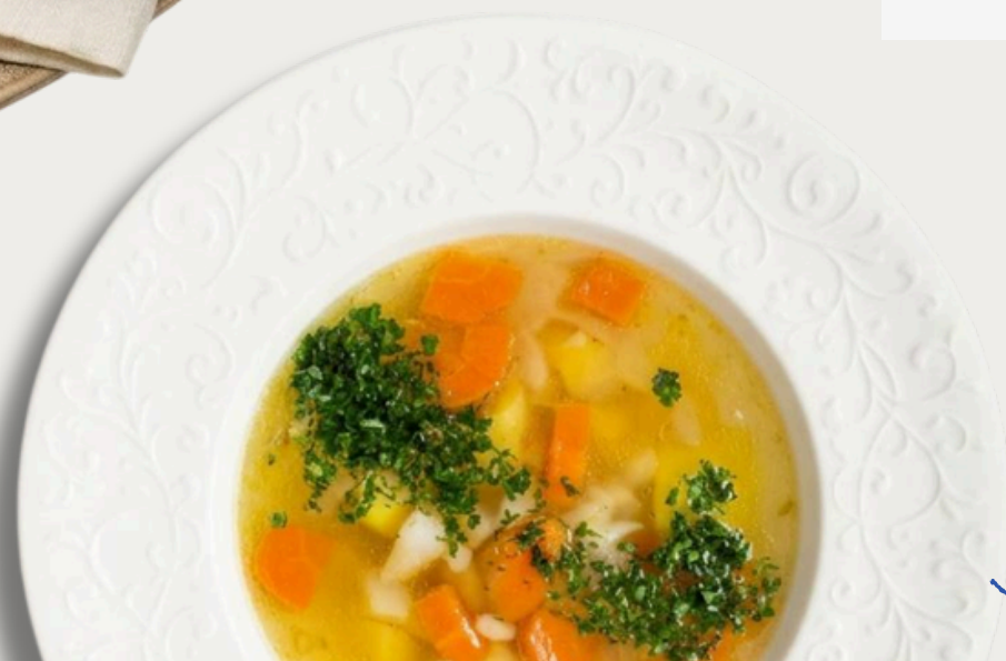
Уха с судаком 320г/630р