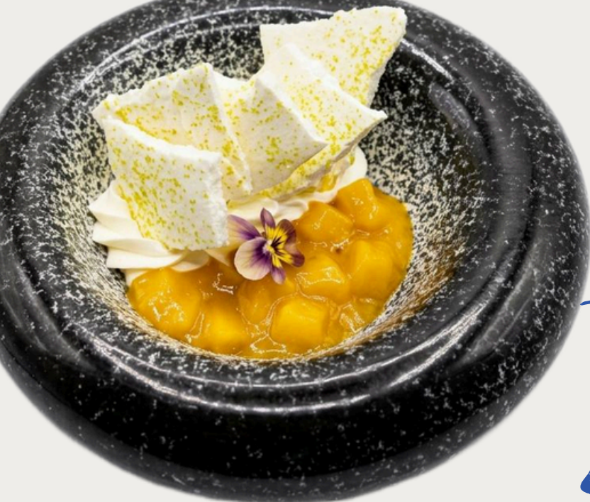
Бе́зе с крем-чиз и компоте манго-маракуйя 130г/480р