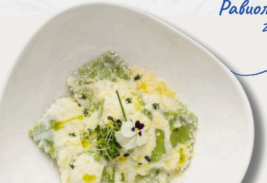
Равиоли с кроликом 200г/750р