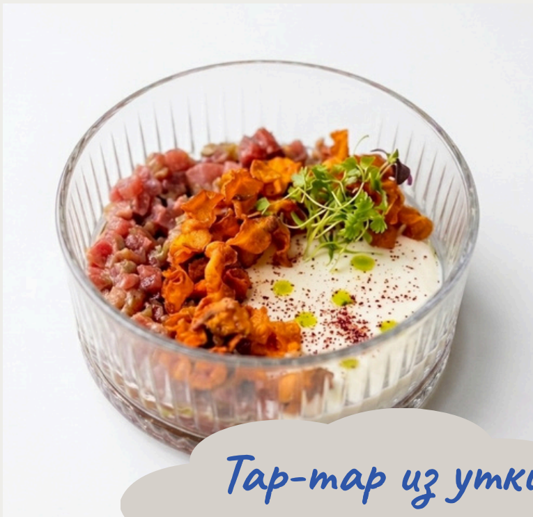
Тар-тар из утки 140г/790р